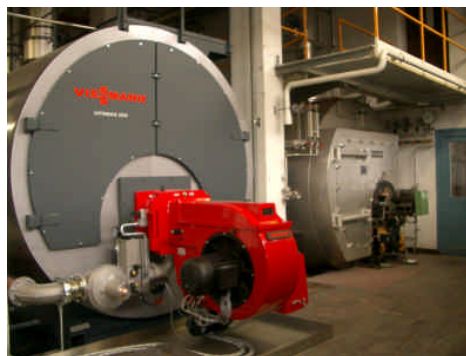
neuer 7MW Warmwasserkessel